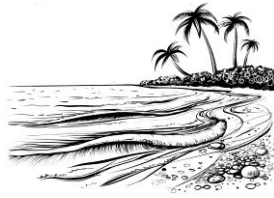
அளை / அலை